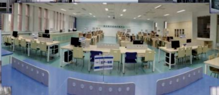
商贸管理类专业 综合训练场所