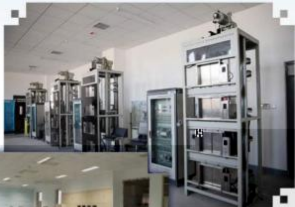
智能电梯安装调试 维护训练场所