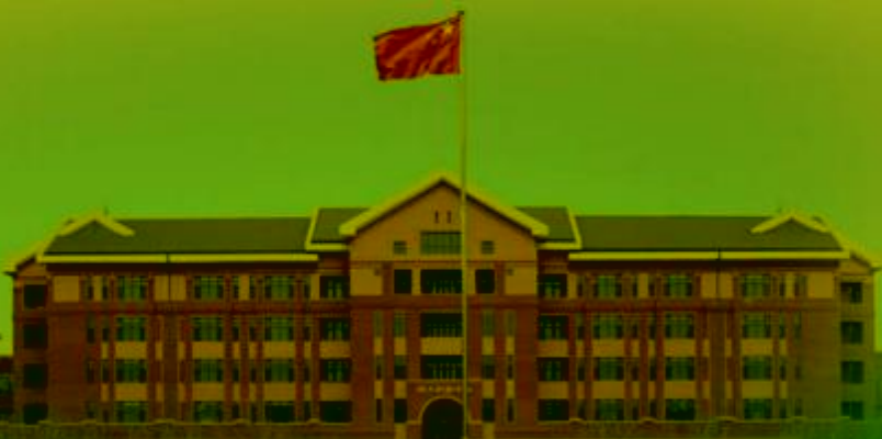
天津机电职业技术学院

TIANJIN VOCATIONAL COLLEGE OF MECHANICAL AND ELECTRICAL ENGINEERING